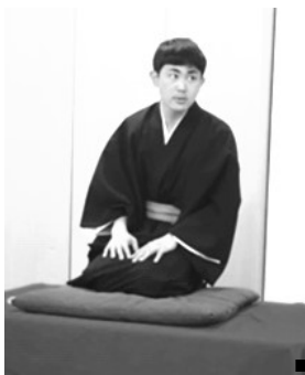
東北学院大学落語研究会